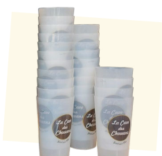
25cl et 50cl